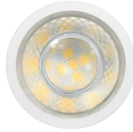
8W = 75W